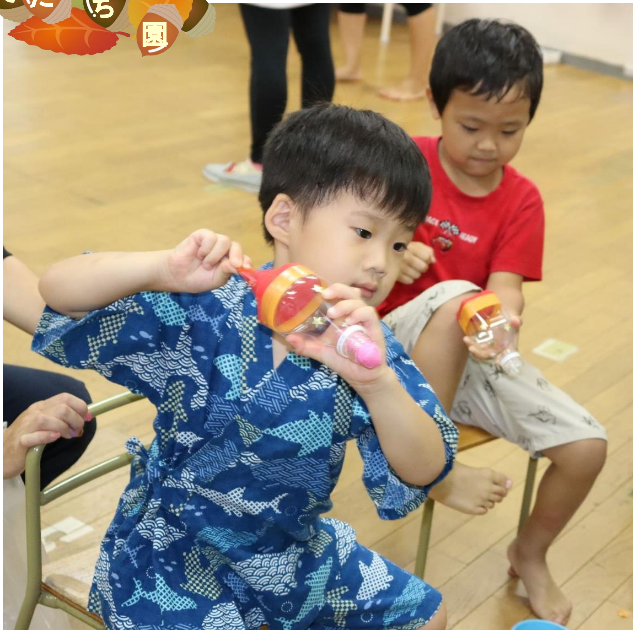
そだち園 夏祭りの様子