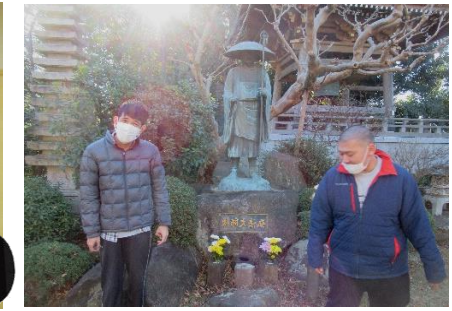
ご近所の慈林薬師へ