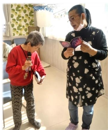
みんなでカラオケ大会