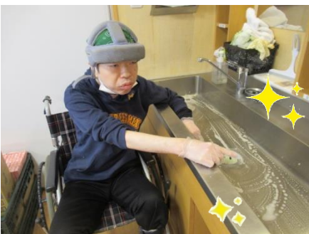
おかげでピカピカです