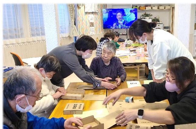
お仕事をしたい方向け！内職作業