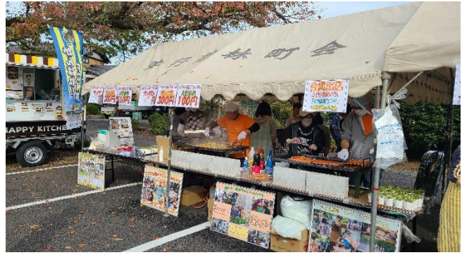
こども食堂じりん・子ども広場「エンジ」・FC 慈林の皆さんにもご参加いただきました。