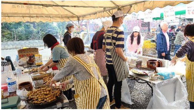
焼き鳥 イベントではすっかり定番になりました。