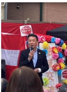
宇田川市議会議員