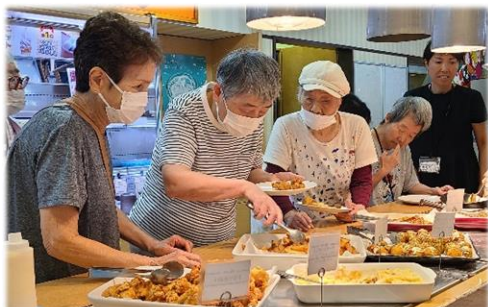
好きな物を選んで…

新堀荘はこれからも定期的なイベントを通して、利用者さんが楽しく過ごせるグループホーム創りをしていきます！