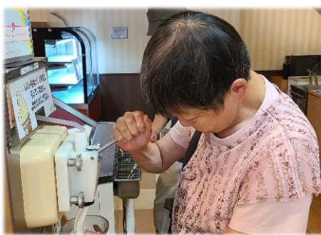
自分ができることに挑戦！