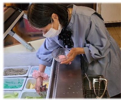
大好きなアイスを！